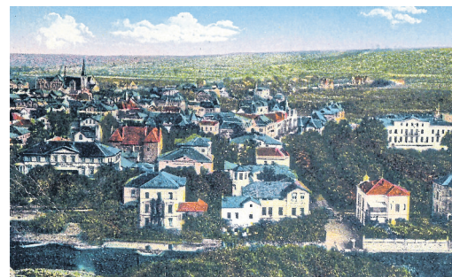
Postkarte aus dem Jahre 1924 mit Blick auf die Nahe.

1934 wird das Hotel in dem Prospekt „Radium-Solbad Kreuznach – Verzeichnis der Hotels, Pensionen, Kurheime und Privatkinderheime(n)“ aufgelistet, und man erfährt, dass es in dieser Zeit 20 Betten anbieten konnte, dazu „fließendes Wasser, Solebäder im Hause, Uferterrasse, Balkonzimmer und Telefon“. Zudem mit „absolut staubfreier Lage am Ufer der Nahe“ warb, Diätküche anbot und während der Saison, die hier vom 1. April bis zum 1. November ging, Zimmerpreise von 2.00 – 3.50 Mark forderte und das Frühstück 1.00 Mark kostete. 12 Bei der Anzahl der Zimmer stand das Hotel in diesem Jahr an 12. Stelle, die größeren Hotels waren das Kurhaus, Hotel Europäischer Hof (ehemals Rhein-stein), Hotel Kauzenberg, Hotel Quellenhof, Kurheim Dr. Brogsitter, Haus Hindenburg, Kurheim Brucker-Harth, Hotel Adler, Parkvilla Aegir und