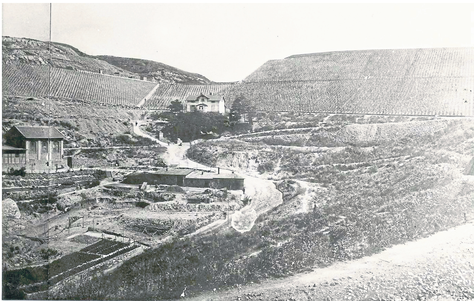
Baustelle der ehemaligen Domäne.

Zweifelsohne wurden vor allem in der önologischen und heimatkundlichen Literatur die Anfangsjahre der Weinbaudomäne etwas eingehender behandelt. Es sei nur kurz in Erinnerung gerufen, dass 1901/02 die preußische Staatsregierung in der Gemarkung Niederhausen 13 Parzellen mit 13,8 ha und in der Gemarkung Schloßböckelheim 13,62 ha, zusammen also 27,2 ha zur Anlage einer fiskalischen Weinbergdomäne vorgesehen hatte. Der heimische Weinbau befand sich aufgrund einer un-